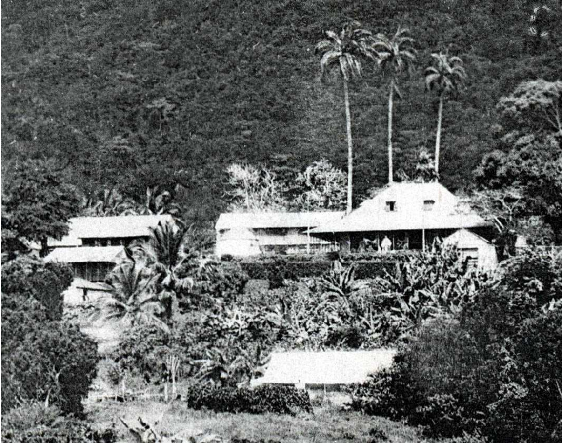
L'Ermitage vers 1928 (FC)

il avait acheté l'habitation caféyère et cacaoyère « L'Hermitage ou Lavilarde » pour 45 000 francs le 01/06/1896 (Me Louis Charles Rodolphe Doüenel) à Saint Ange Rodolphe Barrière, dont la mère était une Texier Lavalade (l'acte reconstitue la filiation de cette famille depuis 1819). Elle était à l'origine propriété des Carra de la Villarde puis des Duquéruy 27 . Pierre Texier Lavalade la leur avait achetée au début du XIXe siècle puis vendue à son fils (02/08/1819 Me Michel). L'habitation l'Ermitage, devenue ensuite propriété des Petrelluzzi (sa fille Laurence et son mari), a été inscrite aux Monuments historiques en 2004 et classée le 19 mai 2006 28 .