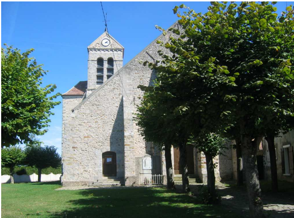
L'église actuelle de Yèbles