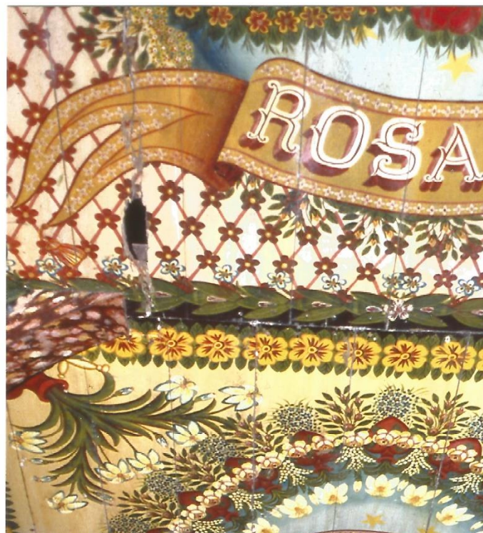
Fresques de Francis Lagrange Église de l'Île Royale

LAGRANGE avait été condamné en 1931 pour avoir reproduit, entre autres, des œuvres d'art de grands peintres, vendues comme originaux. Ces copies étaient si