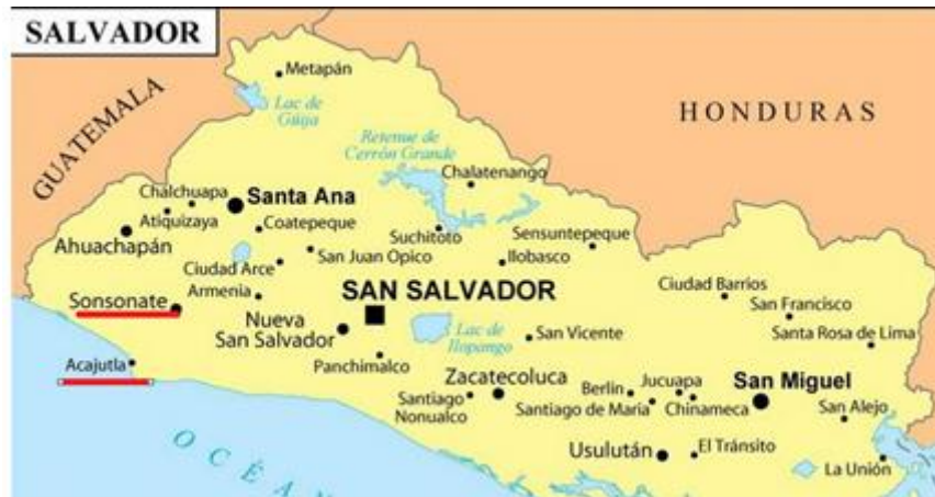
Sonsonate et Acajutla sur la carte du Salvador