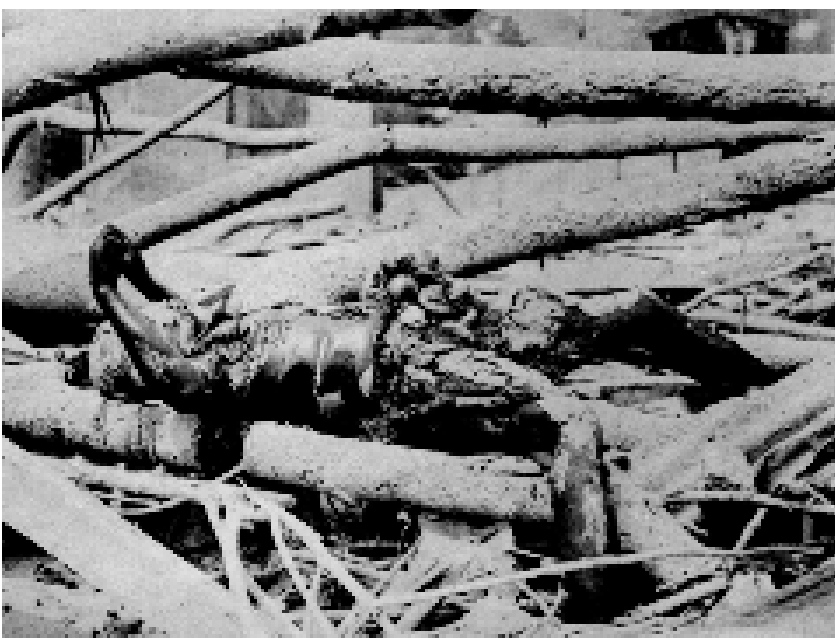
Le cadavre de la place Bertin (collection Ed. Littée)

Le choc moral et nerveux domine le mal physique et tous en portent des marques caractéristiques. Les uns sont muets de stupeur; d'autres, volubiles, racontent inlassablement leur vision de l'enfer et de la pluie de feu. D'autres ont perdu la raison et chantent.